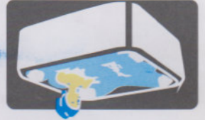
SPA池水循环 Recirculation of water in SPA equipment