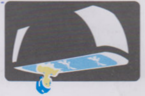
浴缸水循环 Recirculation of water in Bathtub pump

EN 60335-1: 2012+A11 EN 60335-2-60: 2003+A1+A2+A11+A12 EN 62233: 2008 EN 60335-2-30: 2009 EN 60335-2-35: 2002+A1+A2 EN60335-2-80: 2003+A1+A2